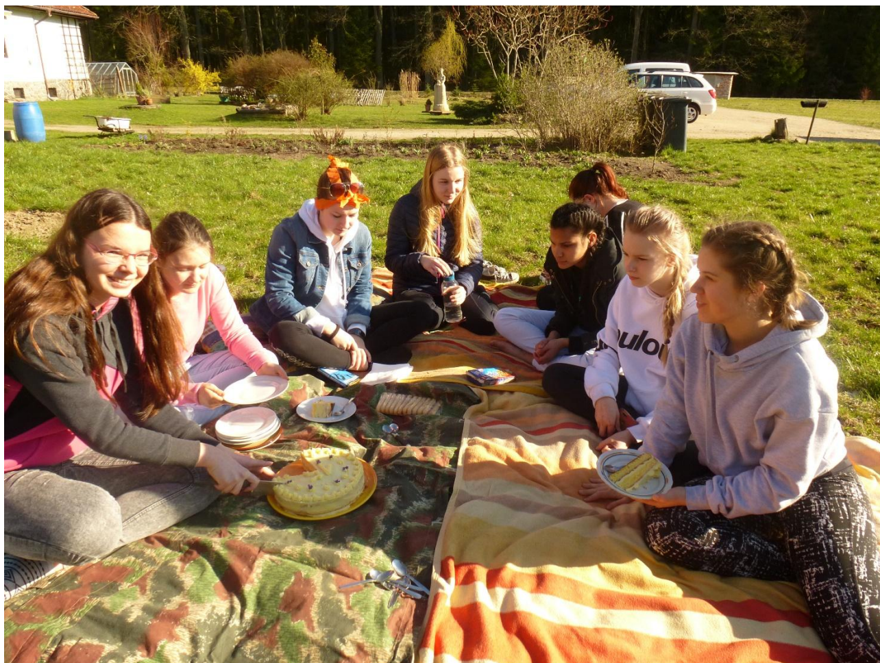
Foto ze společného víkendu gen 3 na Majdaleně.