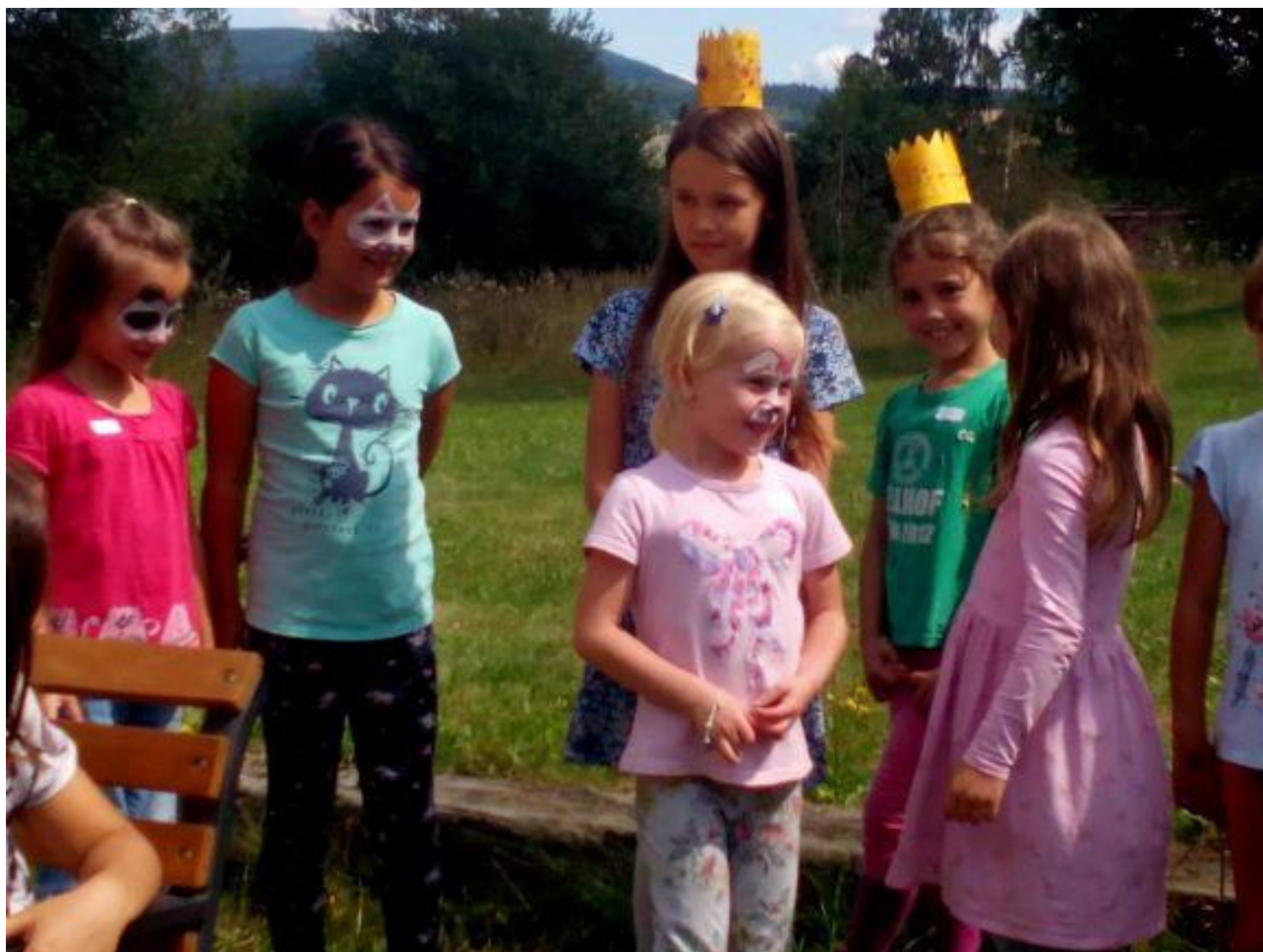
Foto: příprava a cesta na návštěvu v domově důchodců